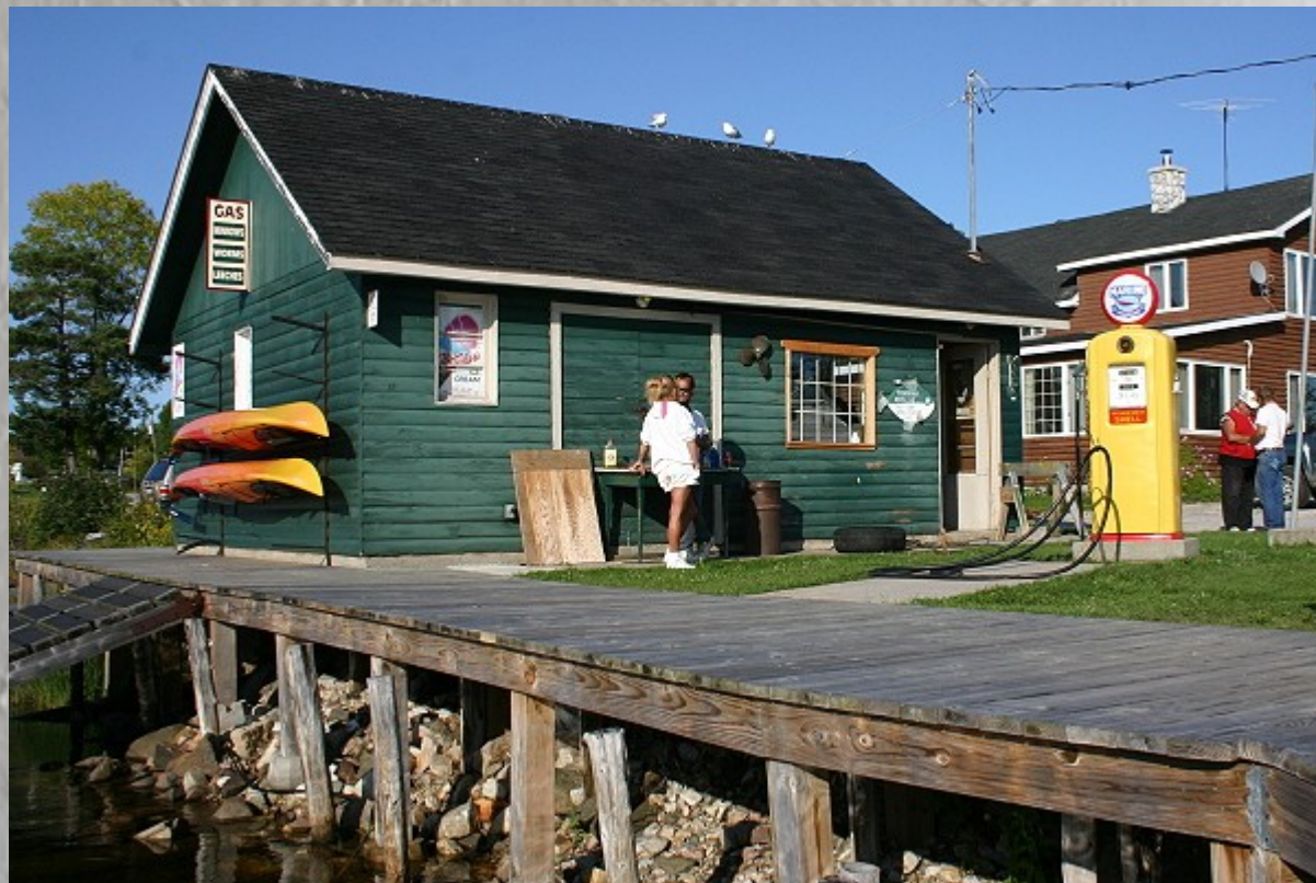
Das sind die kleinen Highlights am Wegesrand, stehen in keinem Reiseführer und man

enthalten. Eigentlich wollten wir heute noch bis Spanish. Doch bei dem strahlenden Sonnenschein und der tollen Umgebung blasen wir in Whitefish Falls die restliche Strecke ab. Im Ort liegen zwei kleine Cottage Resorts entlang der Flussmündung. Das erste ist belegt, das zweite bietet uns ein Cottage mit Doppel- und Einzelbett für 75C$ an. Direkt am Wasser. Ganz ok, nehmen wir. Es gibt noch mehr Cottages in einem weiteren Resort, aber die sind bestenfalls für die zahlreichen Angler hier geeignet. Ich gehe mit Celina spazieren. Auf den Bootsstegen entlang, vorbei an Hobbyanglern die gerade zwei Lachse ausnehmen, bis vor zum See. Die Felsen hier sind kugelrund und haben alle Riefen in einer Richtung. Schönen Gruß von der Eiszeit. Weiter hinten steht die Anglerbasis. Davor eine Zapfsäule für die Boote. Ich zücke die Kamera und bitte um ein Foto. Den Jungs schwillt die Brust. Die Zapfsäule ist von 1935, wurde von ihnen restauriert und in Shell Originalfarben gestrichen.